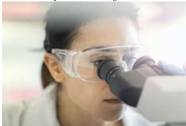
Figura 2.2– E mais uma figura e mais uma legenda.

Praesent id turpis a tortor faucibus consectetur. Maecenas efficitur ipsum vel libero dignissim, ac luctus mauris ornare. In lobortis et tortor eu faucibus. Integer libero odio, fringilla vitae ornare sit amet, porta ac justo. Praesent ut quam gravida velit rhoncus tempus ut vitae magna. Pellentesque ut porta leo. Morbi viverra sodales orci in laoreet. Duis iaculis velit eu nisi luctus ullamcorper. Aliquam porta nisi non mattis vulputate. Integer a mollis neque, sed vulputate lectus. Sed tincidunt aliquam elit ac fringilla.